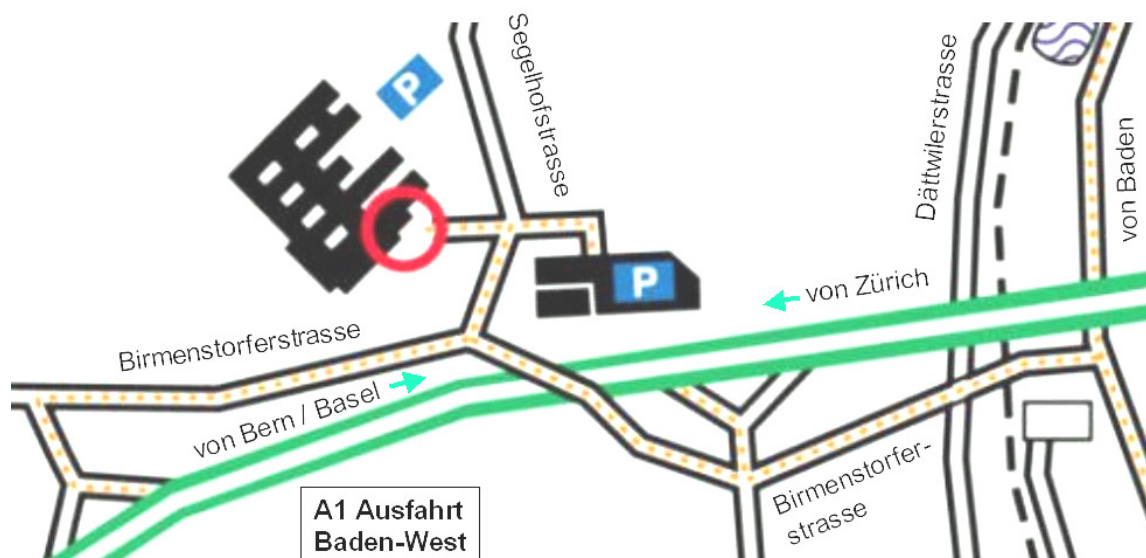
ABB Schweiz AG Forschungszentrum Im Segelhof 5405 Baden-Dättwil